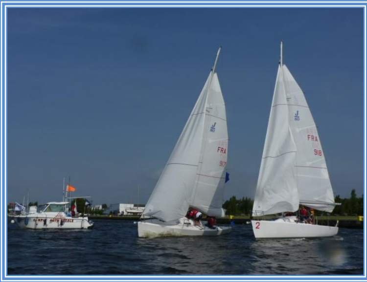
GTN au coude à coude avec AXIANS-OPTEOR lors du 1 er duel de la soirée.